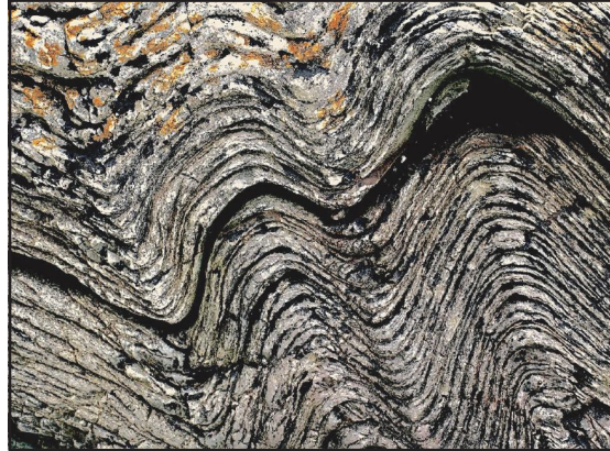
Dimension Dezimeter bis Meter