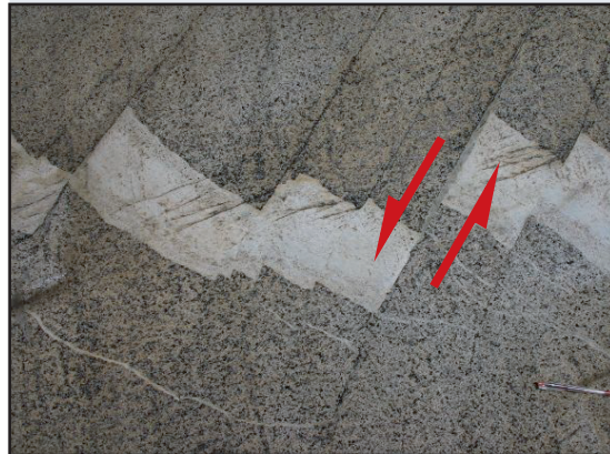
Dimension Dezimeter bis Meter