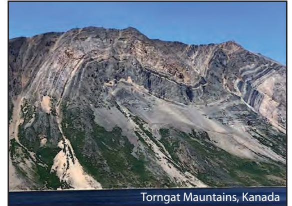
Torngat Mountains, Kanada

Plastische Faltung bei erhöhtem Druck und Temperatur