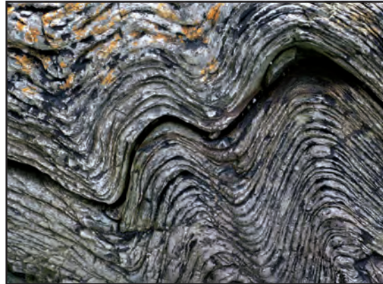
Dimension Dezimeter bis Meter