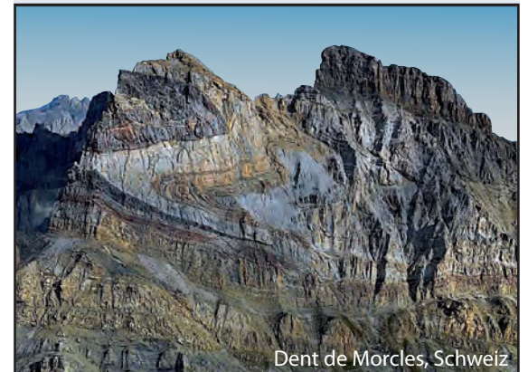
Dent de Morcles, Schweiz